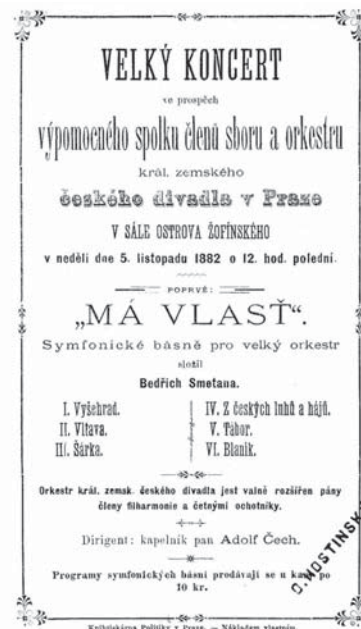
Dobový plakát k premiéře Mé vlasti z 5. listopadu roku 1882.